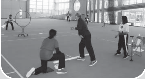
フライングディスク競技に出場