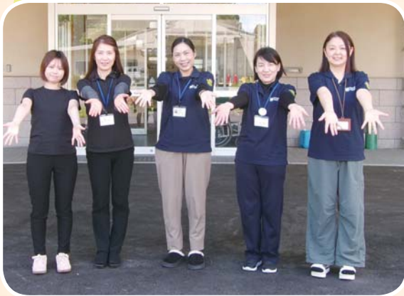
〈ケアマネージャー職員〉