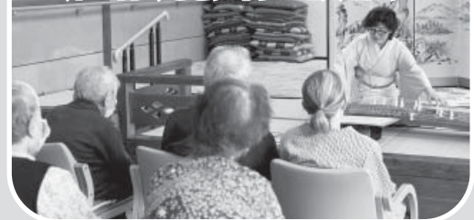
美しい琴の音色に包まれ、利用者の皆さまも 楽しいひとときを過ごされました♪