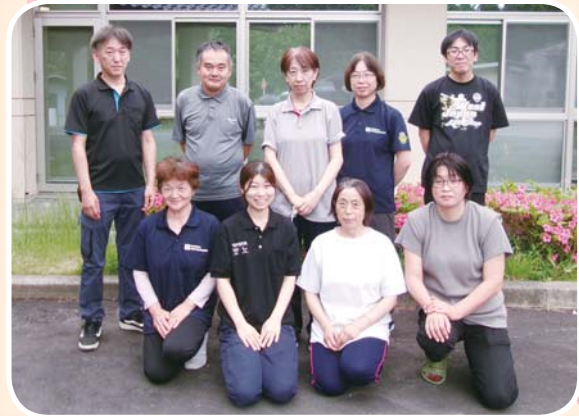
〈テイサービス職員〉